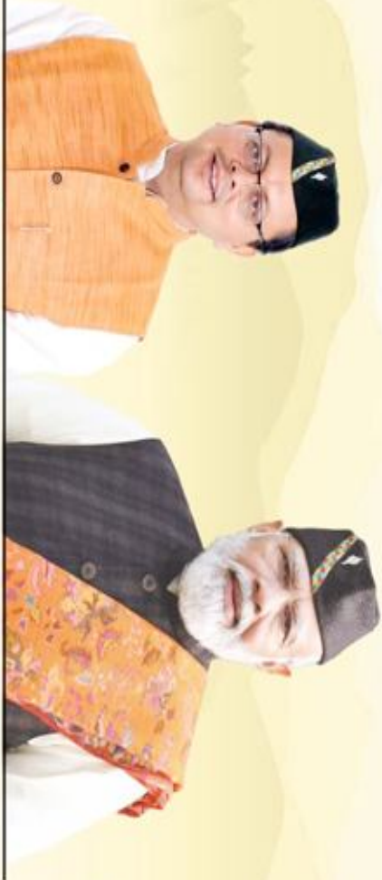
पुष्कर सिंह धामी मुख्यमंत्री